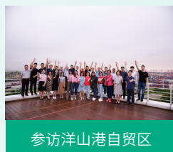
参访洋山港自贸区