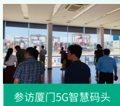
参访厦门5G智慧码头